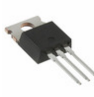
IRF830 Electro-Films (EFI) / Vishay MOSFET N-CH 500V 4.5A TO-220AB