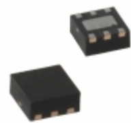
MIC5319-2.85YML-TR Microchip Technology IC REG LDO 2.85V 0.5A 6MLF