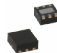
MIC5319-2.7YML-TR Microchip Technology IC REG LDO 2.7V 0.5A 6MLF