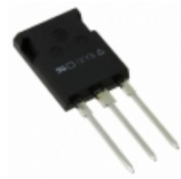
DSEP30-12CR IXYS DIODE GEN 1.2KV 30A ISOPLUS247