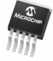
MCP1827-3302E/ET Microchip Technology IC REG LDO 3.3V 1.5A DDPAK