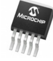
MCP1827-5002E/ET Microchip Technology IC REG LDO 5V 1.5A DDPAK