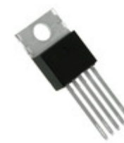
MCP1827-3302E/AT Microchip Technology IC REG LDO 3.3V 1.5A TO220-5