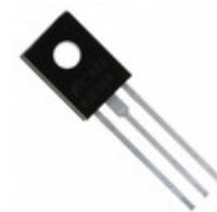
BD37925STU Fairchild/ON Semiconductor TRANS NPN 80V 2A TO-126