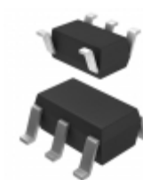
AP2112K-1.2TRG1 Diodes Incorporated IC REG LDO 1.2V 0.6A SOT-23-5