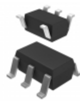
AP2112K-1.8TRG1 Diodes Incorporated IC REG LDO 1.8V 0.6A SOT25