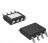
AP2111MP-1.2TRG1 Diodes Incorporated IC REG LDO 1.2V 0.6A