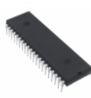
TC534CPL Microchip Technology IC DATA ACQ SUBSYSTEM 40DIP