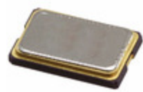
CX532Z-A5B3C5-70-18.432D18 Cardinal Components Inc. CRYSTAL 18.4320MHZ 18PF SMD