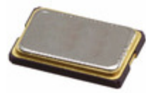
CX532Z-A5B3C5-70-20.0D18 Cardinal Components Inc. CRYSTAL 20.0000MHZ 18PF SMD