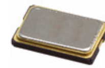
CX532Z-A5B3C5-70-25.0D18 Cardinal Components Inc. CRYSTAL 25.0000MHZ 18PF SMD