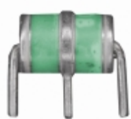
2036-20-B3LF Bourns Inc. GDT 200V 20% 10KA THROUGH HOLE