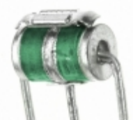
2036-20-B2F Bourns Inc. GDT 200V 20% 10KA T/H FAIL SHORT