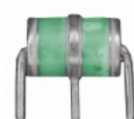
2036-20-B2 Bourns Inc. GDT 200V 20% 10KA THROUGH HOLE