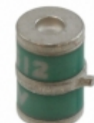
2036-20-AF Bourns Inc. GDT 200V 20% 10KA FAIL SHORT