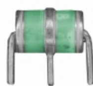
2036-20-B2LF Bourns Inc. GDT 200V 20% 10KA THROUGH HOLE