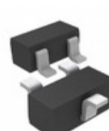
RB548WTL Rohm Semiconductor DIODE ARRAY SCHOTTKY 30V EMD3