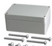
RB53P06G16G Serpac Electronic Enclosures BOX PLASTIC GRAY 4.72"L X 3.15"W