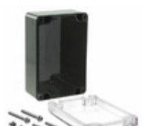
RB53P06C16B Serpac Electronic Enclosures BOX PLSTC BLK/CLR 4.72"LX3.15"W