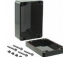
RB53P06B16B Serpac Electronic Enclosures BOX PLSTC BLACK 4.72"L X 3.15"W