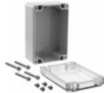
RB53P06C16G Serpac Electronic Enclosures BOX PLSTC GRAY/CLR 4.72"LX3.15"W