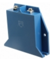
B80K250 EPCOS (TDK) B80K250 EPCOS (TDK)