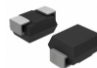
1SMB5940BT3G ON Semiconductor DIODE ZENER 43V 3W SMB