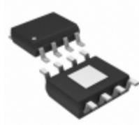
MIC59300-1.2YME-TR Microchip Technology IC REG LDO 1.2V 3A 8SOIC