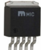
MIC59300-1.2WU Microchip Technology IC REG LDO 1.2V 3A TO263-5