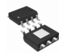
MIC59300-1.2YME Microchip Technology IC REG LDO 1.2V 3A 8SOIC