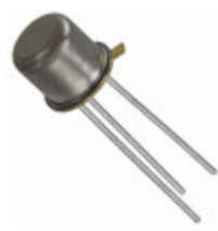
JAN2N2369A Microsemi Corporation TRANS NPN 15V TO18