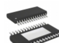
A3977KLPTR-T Allegro MicroSystems, LLC IC MOTOR DRIVER PAR 28TSSOP