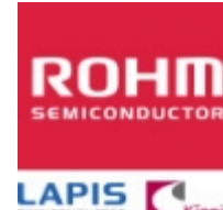
DTA043EEB ROHM DTA043EEB ROHM