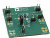
ADP166UJ-EVALZ ADI (Analog Devices, Inc.) BOARD EVAL FOR ADP166