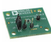
ADP166CB-EVALZ ADI (Analog Devices, Inc.) BOARD EVAL FOR ADP166