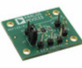
ADP166CP-EVALZ ADI (Analog Devices, Inc.) BOARD EVAL FOR ADP166