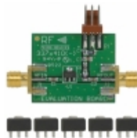
RF3374PCK-410 RFMD KIT EVAL FOR RF3374