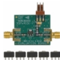
RF3376PCK-410 RFMD KIT EVAL FOR RF3376