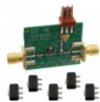
RF3375PCK-410 RFMD KIT EVAL FOR RF3375