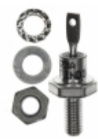
VS-1N3673A Electro-Films (EFI) / Vishay DIODE GEN PURP 1KV 12A DO203AA