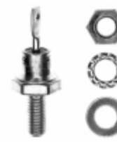
VS-1N3671A Vishay Semiconductor Diodes Division DIODE GEN PURP 800V 12A DO203AA