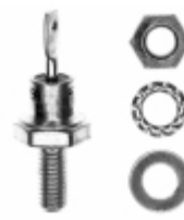
VS-1N3672A Vishay Semiconductor Diodes Division DIODE GEN PURP 900V 12A DO203AA