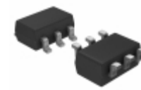
MIC5320-PKYD6-TR Microchip Technology IC REG LDO 3V/2.6V TSOT23-6