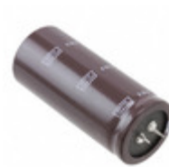
EKMH350VND333MA63T United Chemi-Con CAP ALUM 33000UF 20% 35V SNAP