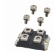
DSA300I200NA IXYS DIODE MODULE 200V 300A SOT227B