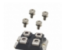
DSA300I100NA IXYS DIODE SCHOTTKY 100V 300A SOT227B