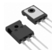
DSA30C150HB IXYS DIODE ARRAY SCHOTTKY 150V TO247