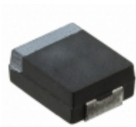
CWR29MK156KBXC AVX Corporation CAP TANT 15UF 10% 35V 2721