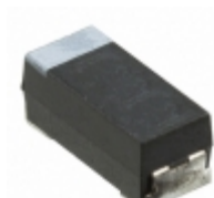
CWR29KK106KBGZ AVX Corporation CAP TANT 10UF 10% 25V 2711