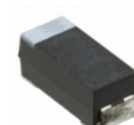
CWR29MC685KCGC AVX Corporation CAP TANT 6.8UF 10% 35V 2711