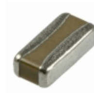
06125A470KAT2V AVX Corporation CAP CER 47PF 50V NP0 0612