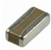
06123C823MAT2A AVX Corporation CAP CER 0.082UF 25V X7R 0612