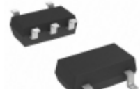
DMG263010R Panasonic Electronic Components TRANS NPN/PNP PREBIAS 0.3W MINI5