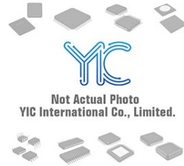
XC17S40XLPD8I/XC17S40LPI XILINX XC17S40XLPD8I/XC17S40LPI XILINX