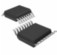
MC74VHCT139ADTRG ON Semiconductor IC DCODER/DMUX DUAL 2-4 16- TSSOP