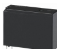
ALD112 Panasonic Electric Works RELAY GEN PURPOSE SPST 3A 12V