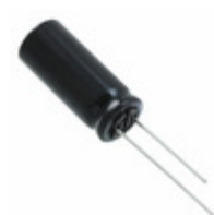
EEU-FS1C392L Panasonic CAP ALUM 3900UF 20% 16V T/H