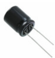
EEU-FS1C472SB Panasonic CAP ALUM 4700UF 20% 16V T/H