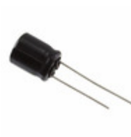
EEU-FS1C821 Panasonic CAP ALUM 820UF 20% 16V THRU HOLE