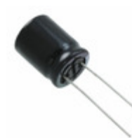
EEU-FS1C472S Panasonic CAP ALUM 4700UF 20% 16V T/H