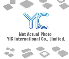
LNBK20D2 ST LNBK20D2 ST