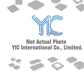
LNBK15SP ST ST SOP10