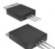
BP5277-90 Rohm Semiconductor IC BUCK CONVERTER MOD 9.0V SIP3