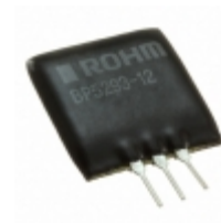
BP5293-12 Rohm Semiconductor DC/DC CONVERTER 12V 1A