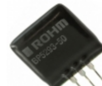
BP5293-50 Rohm Semiconductor DC/DC CONVERTER 5V 1A