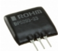
BP5293-33 Rohm Semiconductor DC/DC CONVERTER 3.3V 1A