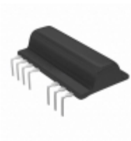
BP5311XA Rohm Semiconductor IC DC/DC CONVERTER STEPUP SIP9