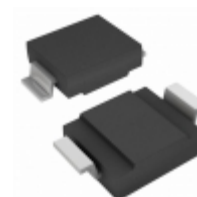
SMCG120A-E3/9AT Electro-Films (EFI) / Vishay TVS DIODE 120V 193V DO215AB