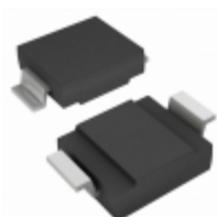
SMCG120AHE3/9AT Electro-Films (EFI) / Vishay TVS DIODE 120V 193V DO215AB