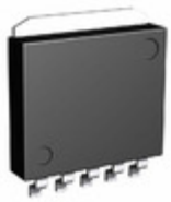
BA18DD0WHFP-TR Rohm Semiconductor IC REG LDO 1.8V 2A HRP5