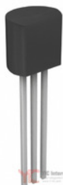
Image may be representation. See specs for product details.