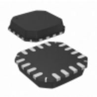
AD8426BCPZ-R7 Analog Devices Inc. IC OPAMP INSTR 1MHZ RRO 16LFCSP