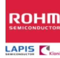
2SAR513P ROHM 2SAR513P ROHM