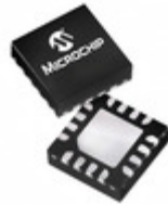
PIC16F1574-I/JQ Microchip Technology IC MCU 8BIT 7KB FLASH 16UQFN