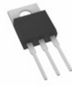
BYV32-150801HE3/45 Electro-Films (EFI) / Vishay DIODE ARRAY GP TO220AB