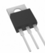
BYV32-200-E3/45 Vishay / Semiconductor - Diodes Division DIODE ARRAY GP 200V 18A TO220AB