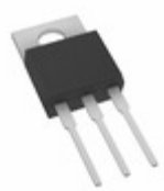
BYV32-100HE3/45 Electro-Films (EFI) / Vishay DIODE ARRAY GP 100V 18A TO220AB