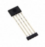
A1363LKTTN-1-T Allegro MicroSystems, LLC SENSOR LINEAR ANALOG MOD