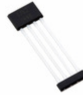
A1363LKTTN-10-T Allegro MicroSystems, LLC SENSOR LINEAR ANALOG 4SIP