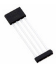
A1363LKTTN-5-T Allegro MicroSystems, LLC SENSOR LINEAR ANALOG 4SIP