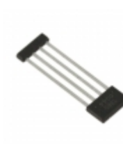
A1362LKTTN-T Allegro MicroSystems, LLC SENSOR LINEAR ANALOG 4SIP