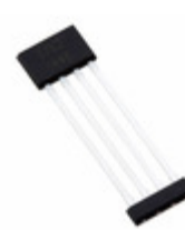
A1363LKTTN-2-T Allegro MicroSystems, LLC SENSOR LINEAR ANALOG 4SIP