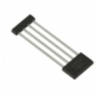
A1361LKTTN-T Allegro MicroSystems, LLC SENSOR LINEAR ANALOG 4SIP