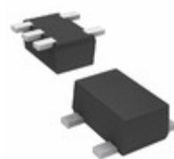
DMC561070R Panasonic Electronic Components TRANS 2NPN PREBIAS 0.15W SMINI5