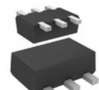
DMC564010R Panasonic Electronic Components TRANS PREBIAS DUAL NPN SMINI6