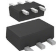
DMC564020R Panasonic Electronic Components TRANS 2NPN PREBIAS 0.15W SMINI6