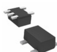
DMC562050R Panasonic Electronic Components TRANS 2NPN PREBIAS 0.15W SMINI5