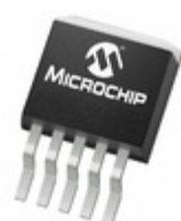
MCP1827T-3002E/ET Microchip Technology IC REG LDO 3V 1.5A DDPAK