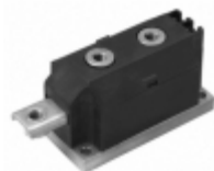
VSKH230-20D32 Electro-Films (EFI) / Vishay SCR 2000-3200V 230A MAGN-A- PAK