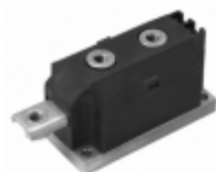
VSKH230-20D32 Vishay Semiconductor Diodes Division SCR 2000-3200V 230A MAGN-A- PAK