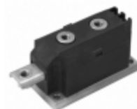
VSKH230-16D25 Vishay Semiconductor Diodes Division SCR 1600-2500V 230A MAGN-A- PAK