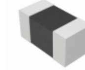
EZJ-ZZV800AA Panasonic Electronic Components VARISTOR 80V 0201