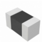
EZJ-ZZV120EA Panasonic Electronic Components VARISTOR 12V 1A 0201