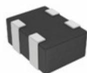
EZJ-ZSV270DAK Panasonic Electronic Components VARISTOR 27V 5A 0504