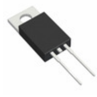
UG12J C0G TSC (Taiwan Semiconductor) DIODE GEN PURP 600V 12A TO220AC