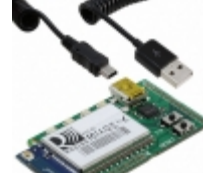
RN-131-EK Microchip Technology RN131 EVALUATION KIT