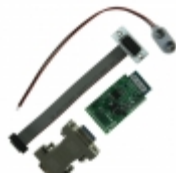
RN-134-K Microchip Technology KIT EVAL WIFLY GSX 802.11 RN-134