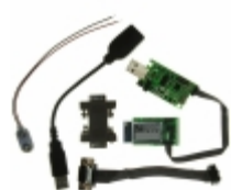
RN-131G-EVAL Microchip Technology EVALUATION KIT FOR RN-131G