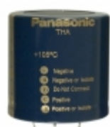
ECE-T2GA561EA Panasonic Electronic Components CAP ALUM 560UF 20% 400V SNAP