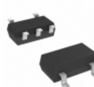
S-80141CNMC-JK2T2G SII Semiconductor Corporation IC VOLT DETECTOR 4.1V SOT23-5