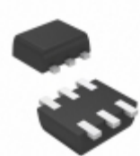
DMC2450UV-7 Diodes Incorporated MOSFET N/P-CH 20V SOT563