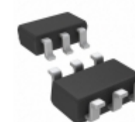
DMC25D1UVT-13 Diodes Incorporated MOSFET N/P-CH 25V/12V TSOT26