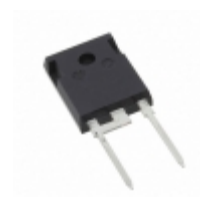
GDP60P120B Global Power Technologies Group DIODE SCHOTT 1.2KV 60A TO247-2