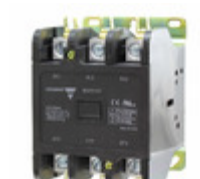
GDP753L120V Carlo Gavazzi 3P DPC LUG TERM 75A 120VAC