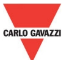
GDP753L24V Carlo Gavazzi 3P DPC LUG TERM 75A 24VAC