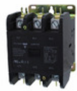
GDP753L220V Carlo Gavazzi 3P DPC LUG TERM 75A 220VAC