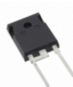
GDP60Z120E Global Power Technologies Group DIODE SCHOTT 1.2KV 60A TO247-2