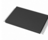
AT28LV256-20TI Microchip Technology IC EEPROM 256KBIT 200NS 28TSOP