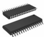
AT28LV010-25SI Microchip Technology IC EEPROM 1MBIT 250NS 32SOIC